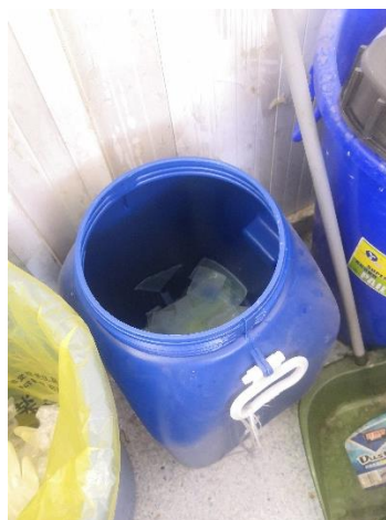
生科楼 A6004—废胶桶未贴标签、无盖，（左图为初查，右图为复查） （已多次通报），负责人张绍玲