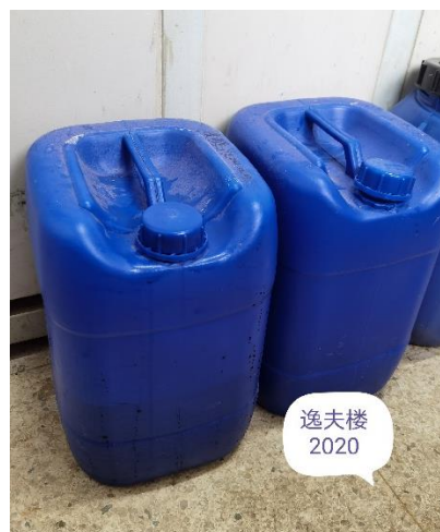
逸夫楼 2020—废液桶未张贴标签且无防漏托盘。